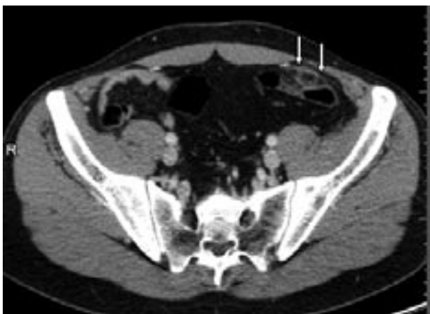
Figure 1 - Coupe tomодensitométrique montrant la petite formation graisseuse entouré d'un halo hyperdense (flèches), en regard de la paroi du colon sigmoïde : aspect typique d'une appendagite.

Sous traitement anti-douleur et anti-inflammatoire , l'évolution du patient a été rapidement favorable.