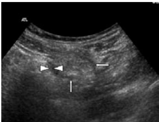
Figure 3 – Aspect échographique d'une appendagite, vue chez un autre patient admis pour une douleur aiguë de la fosse iliaque gauche, sans anomalie biologique spécifique. L'anomalie est constituée d'une formation ovoïde hyperéchogène (flèches blanches) bordée d'un halo hypoéchogène (têtes de flèches blanches).

On peut aussi remarquer en regard de la lésion un épaississement inflammatoire du péritoine adjacent.